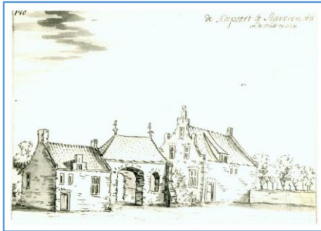
De Koepoort door J. Stellingwerf in 1723

In de Leeuwarder Courant verschijnt op 6 maart 1830 het volgende bericht: Het Bestuur der stad Stavoren is voornemens om op vrijdag 24 maart 1830, des voormiddags om 11 uur op het