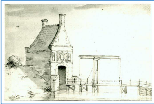
De Zuiderpoort of "de poort naar het Rode Klif" in 1723 door J. Stellingwerf.

Naast de in 1581 gedeeltelijk herstelde delen van het Blokhuis, wat op verschillende 17e eeuwse kaarten goed is te zien, waren er in de vestingwallen nog drie stads- en twee waterpoorten gebouwd, respectievelijk de Haven- of Noorderpoort, de Zuiderpoort, de Koepoort en de Noorder- en Zuiderpijp.