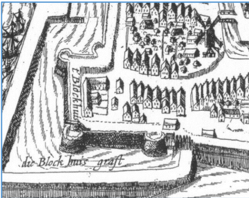
Fragment stadkaart N. Geilkercken uit 1616 met het herbouwde blokhuis.

Zoals we inmiddels weten is het Blokhuis in 1522 op last van Keizer Karel V gebouwd. Het heeft echter nog geen 60 jaar stand gehouden, want in mei 1581 werd het na een hevige strijd geheel afgebroken. Dit lijkt een wat vreemde actie, omdat op de puinresten de muren en hoektorens aan de zee- en havenzijde al na een jaar weer opgebouwd werden, terwijl de binnenplaats beschikbaar werd gesteld voor de bouw van woonhuizen. Gelijkzeitig werd de stad in oostelijke richting uitgebreid tot de huidige Schans en aan de zuidzijde tot de Stadsfenne. Alle werken werden aangelegd volgens de toen geldende moderne militaire principes, vergelijkbaar met andere Nederlandse vestingplaatsen.