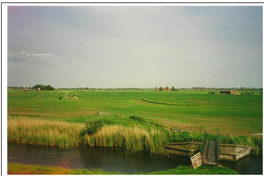
de "barte" in de Noorder-dijksvaart bij "Schramshiem".

1989 Gevraagd aan eigenaar boer Eriks of hij de naam "Schrams-hiem" kende. Jazeker, zei hij, dat is een stuk land van mij tegen de dijksvaart, bij een vroegere polderdijk, groot ongeveer 5 pdm. Vorig jaar is het land gevreesd en er kwam veel puin te voorschijn.