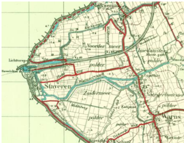
Topografische kaart ca 1950

De Noordermeer kon met één watermolen worden drooggehouden, terwijl de Zuidermeer die lager oftewel dieper ligt, door twee watermolens.