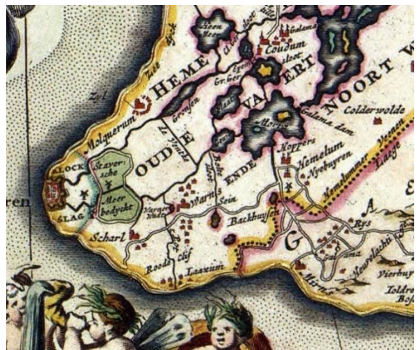
Bernardus.Schotanus 1677, Frisiae Nicolai Vischer

De kronieken en geschiedenisboeken reppen niet over wie die andere lieden waren en hoe hoog die onkostenvergoeding dan wel was.