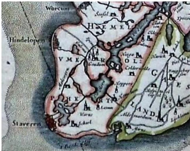
Adriano Metio en Gerardo Freitag Frisia Occidentalis, fragment atlas Joan Blaeu.

Zoals u mogelijk weet was Staveren vroeger bijna geheel ingesloten door water. Aan de ene kant lag de dreigende Zuiderzee en aan de andere kant lag een complex aan binnenmeren en waterlopen. Op bijgevoegd kaartje is dat goed te zien.