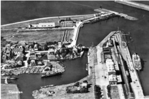
Situatie rond 1950 met de kanthelling van "De Volharding" te Staveren op de vroegere Stadsdwinger in het noordoosten van Staveren

de Noordermeer in het oosten. Lutke Helling lag in het zuiden; Grote Helling lag ten noorden daarvan.