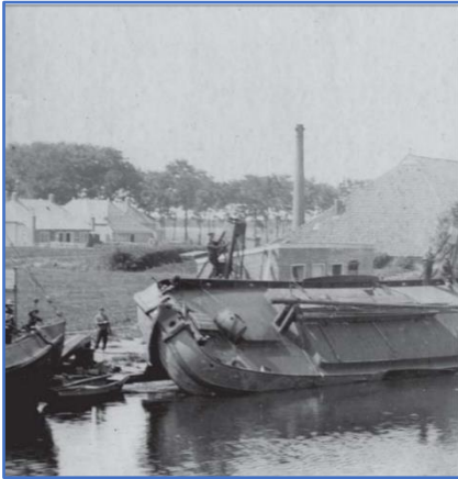
Een langshelling in Winsum, Groningen.

Hoewel we niet twijfelen aan de nautische kennis van de lezers van 't Stavers Krantsie bespreken we, voordat we de geschiedenis induiken, eerst voor de zekerheid nog wat vaktermen. In de gevonden bronnen treffen we over het algemeen de termen sleet- of sleep- en kanthelling aan. Bij het type kant- of dwarshelling, in tegenstelling tot de langshelling, werden de schepen dwars over de lengte "dwarsscheeps" met een slede op het droge getrokken. Dit zien we vooral wanneer het aanliggende vaarwater te smal is om langshellingen te maken. Op de bijgevoegde plaatjes zijn een scheepswerf van een kanthelling in Winsum rond 1920 en die van de scheepswerf "De Volharding" aan het Hellingpad rond 1950 te zien. Langshellingen werden toegepast als het aanliggende vaarwater breed of ruim genoeg was om de schepen haaks op het vaarwater te water te laten of op het droge te trekken. Op de landkaarten herkennen we de plattegrond van de hellingen meestal als een inham langs het vaarwater.