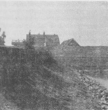
Rede van Molkwerum, plaats waar vroeger de jollen afmeerden.