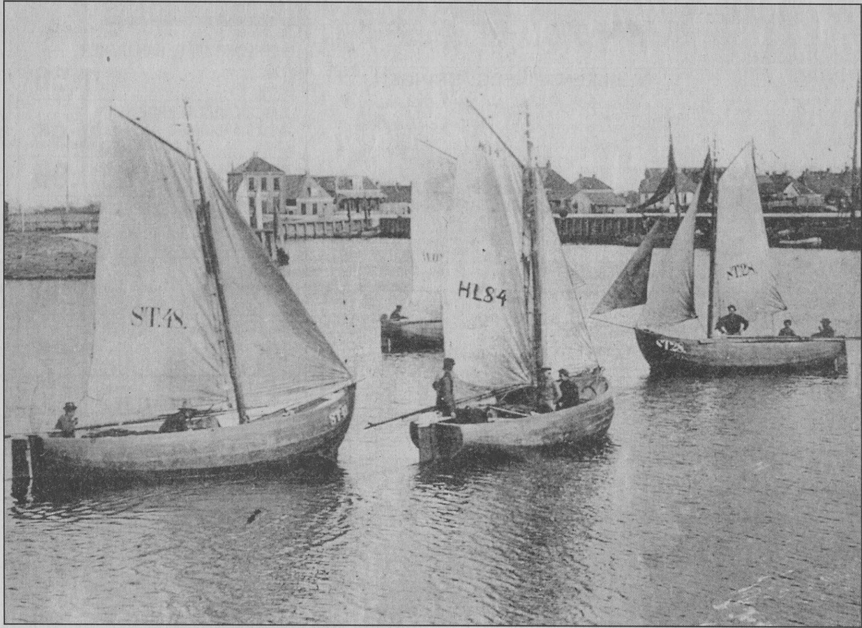
Een ansichtkaart met afbeelding van een aantal Staverve jollen in de havenkom van Stavoren, gemaakt rond 1920.

SNEEK. Van 13 september tot 30 november wordt in het Fries Scheepvaart Mu-