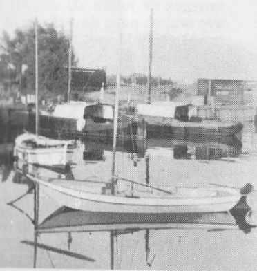
Haven van Laaksum nu.