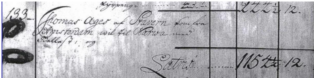
Eén van de Staverse grootschippes in de Sonttolregisters

Het privilege van Staveren kreeg in latere eeuwen een bijna mythische status. De Friese historicus Pierius Winsemius verklaarde in 1644 dat Staveren voorrang had omdat haar schepen als eersten de Sont zouden zijn gepasseerd – de zogenaamde “eerste doorvaart”. Deze verklaring werd in latere kronieken herhaald, soms zelfs teruggeplaatst in de Vikingtijd. Jensen toont overtuigend aan dat deze “eerste doorvaart” geen basis heeft in primaire bronnen en daarom als een constructie moet worden beschouwd die de stedelijke identiteit van Staveren moest versterken. De mythe functioneerde als een vorm van historische legitimering van een feitelijk onduidelijk privilege.