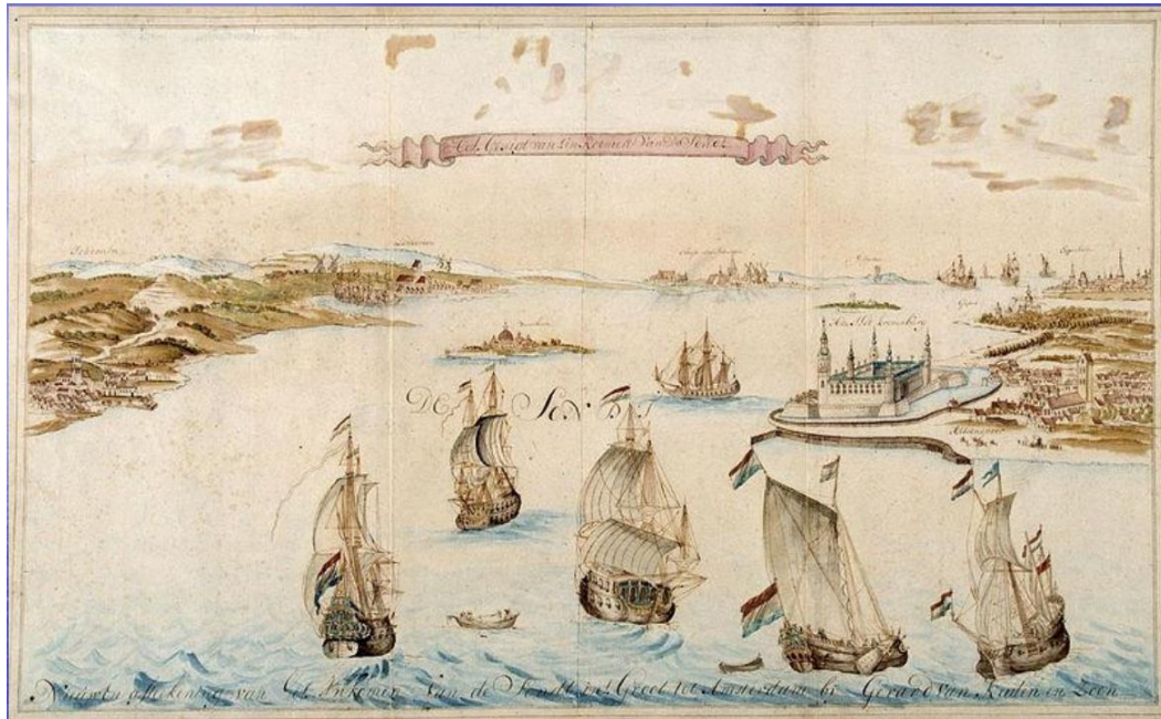
De doorvaart van de Sont meteen konvooi schepen uit Amsterdam