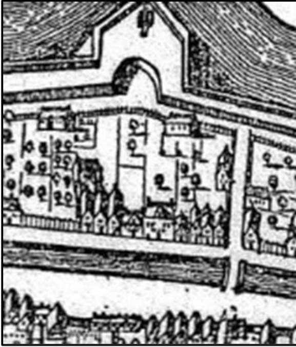
Het weeshuis aan de Oude Stadgracht ca 1664

armenvoogden zorgden dat er toezicht en lijfbehoud over deze kinderen georganiseerd werd.