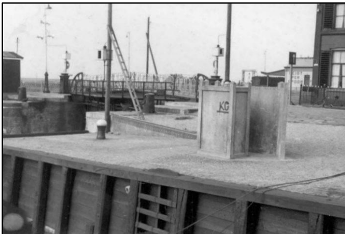
Het urinoir bij de haven rond 1900

Het afval was natuurlijk heel anders van samenstelling dan nu. Plastic was er niet en het organisch afval werd zoveel mogelijk gebruikt als veevoer. Men stookte op turf en hout en de overgebleven as kon men bij de achman kwijt, samen met het andere afval. Hoe dat in zijn werk ging volgt hierna.