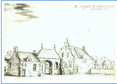
De Koepoort door J. Stellingwerf in 1723

In de Leeuwarder Courant verschijnt op 6 maart 1830 het volgende bericht: Het Bestuur der stad Stavoren is voornemens om op vrijdag 24 maart 1830, des voormiddags om 11 uur op het