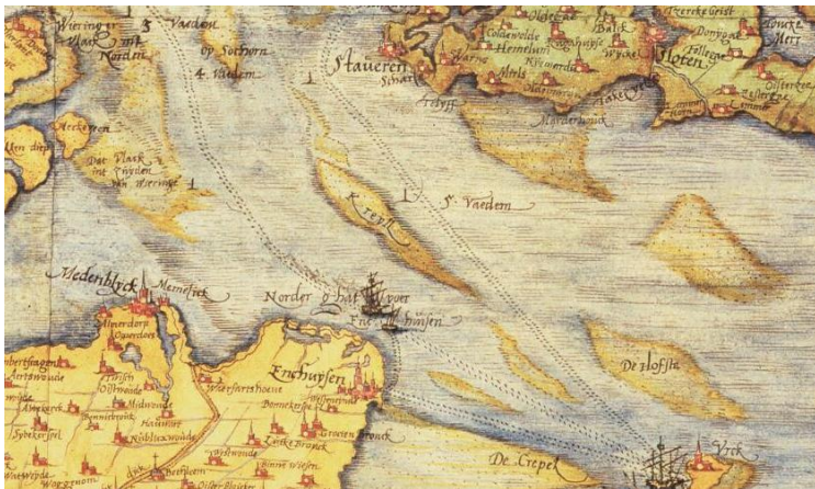
Kaartfragment van de Zuiderzee in 1573 door Chr. Sgrooten

Zo werd bij de bestorming van Hamburg in 824 alleen de Hammaburg verwoest. De suburbia of handelswyk werd met rust gelaten. Dorestad was een uitzonderingsgeval omdat het op de grens van twee verschillende kulturen lag en na de Frankische verovering en de instelling van een Rijkstol als een vijandelijk gebied voor de handel werd beschouwd.