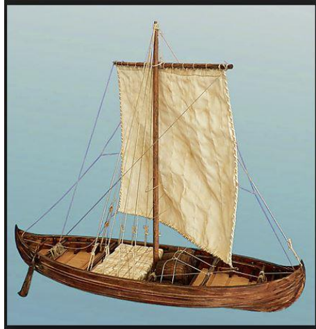
Model van een Knarr

De as werd dan verzameld en uitgekookt, het zout bleef over. Het begrip zoutzieden wijst op een typisch Fries bedrijf want siede betekent nog steeds, koken.