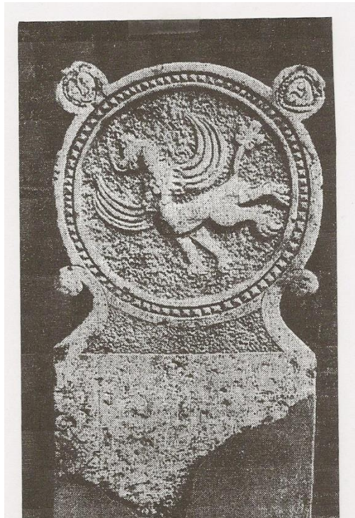
Griffioen voorheen in de Voorstraat te Staveren

Een groot gedeelte van Oud-Staveren verdween in de golven en is in dit boekje weer een beetje boven water geholpen. Zo mag het dan weer een plaats hebben op de kaart, niet als een vervloekte stad zoals het sprookje wil laten geloven, maar als één van de oudste Europese steden met stadsrechten, als een trekpaard in de handelsgeschiedenis van Middeleeuws Europa en tenslotte, als een cultuurhistorische baanbreker voor de huidige Europese Unie.