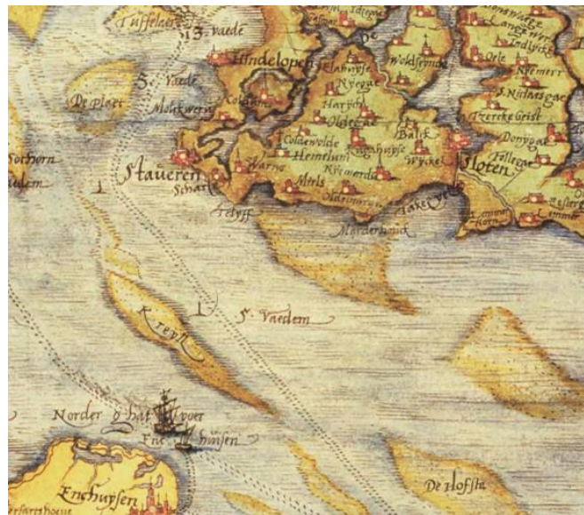
Gedeelte van een kaart van Christiaan Sgrooten uit 1573 met daarin de vaarroutes en de ondieptes ter hoogte van Staveren. Het vrouwenzand is hier al definitief onder de zeespiegel verdwenen.

Deze ondiepte kreeg later de naam Vrouwezand. Door de stijgende zeespiegel raakte de zandbank steeds verder onder water, totdat de Afsluitdijk in 1932 was aangelegd.