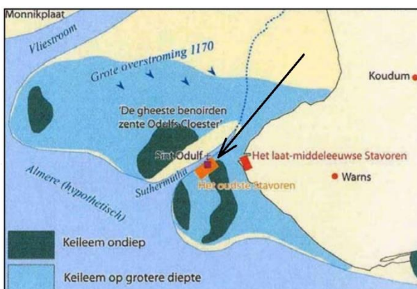
de globale locatie van het oude Staveren en het Sint Odulfusklooster aan.

Uit archeologisch onderzoek langs de Delft bleek dat rond die tijd het oudste Staveren een stadsuitbreiding kreeg. Een strook land van ten minste 825 meter lang aan weerszijden van een veenriviertje, de Nagele, werd ontgonnen en gereed gemaakt voor bewoning. Uit dit archeologisch onderzoek bleek verder dat deze nieuwe nederzetting-in-aanbouw tussen 1120 en 1140 getroffen werd door een overstroming of stormvloed. Toen werd een dik pak klei afgezet op de oevers van wat eerst het "Diept" en later de "Delft" werd genoemd.