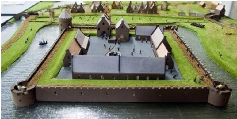
Maquette van het 2 e blokhuis te Stavoren uit 1522. Het 1 e blokhuis uit begin 1598 lag ter hoogte van het restaurant 't Havenhoofd

Nadat in het door de Hollandse graven veroverde Friese gebied enkele dwangburchten waren gebouwd konden ze aanvankelijk hun gezag daar handhaven. In het begin van de 14e eeuw hadden ze in 'Westerlauwers Friesland' een sterke positie in Stavoren. De graaf verbleef daar tijdens zijn bezoeken aan Friesland op 's-Gravenhofstede, waar een verdedigbaar stenen huis ( stins ) was gebouwd. In 1409 en 1410 benoemde de graaf van Holland (Willem VI) een slotvoogd op het kasteel van Stavoren. Deze slotvoogd was tegelijk kapitein en kastelein en voerde het bevel over de soldaten die de graaf daar had gelegerd. In 1411 werd de stad heroverd door de Friezen en kwam er definitief een eind aan de invloed van Hollandse graven. Daarna laaiden de twisten tussen Schieringers en Vetkopers op, waarmee het bovenstaande verhaal eigenlijk mee begint.