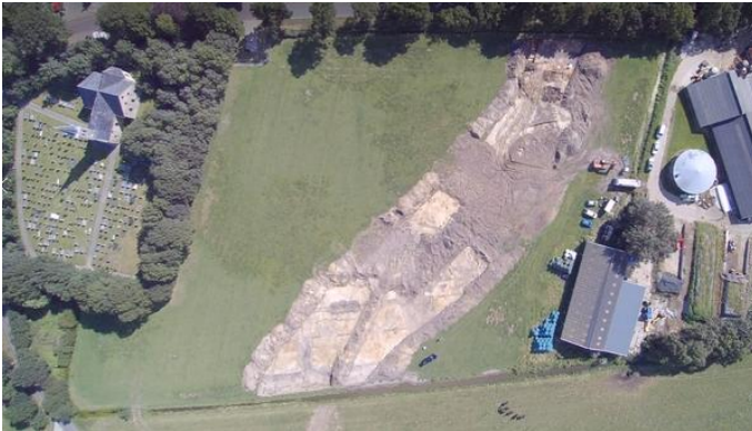
Opraving van 't Spijker te Hemelum (t.b.v. de aanleg van de rondweg)