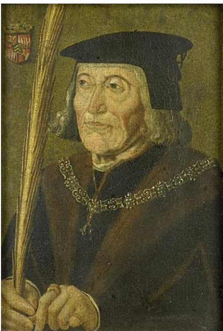
Jan III (Johannes) van Egmond (1438-1516) stadhouder van Zeeland, Holland en West-Friesland

Het strijdboek is in 1518 door de abt en zijn vicaris (plaatsvervanger) van het Odulfusklooster geschreven. In twee delen hebben we de handelingen in en rond Staveren samengevat. In het vorige deel waren we geëindigd met de goedkeuring van de stad Staveren om het klooster naar Hemelum te verplaatsen. Deze beslissing werd volgens ons overgeleverde teksten in 1495 genomen.