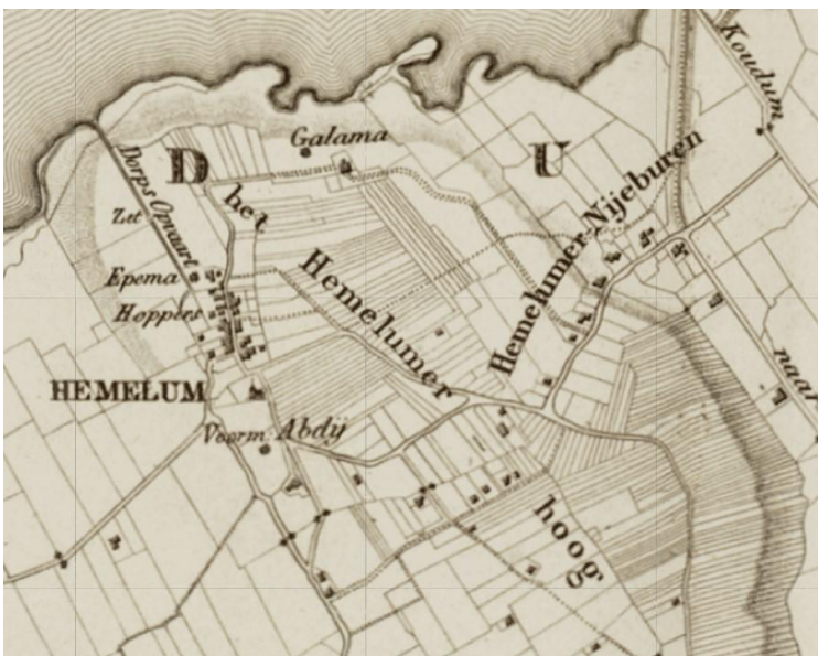
Hemelum met locatie van de kerk en de drie stinsen uit het verhaal

De familie Galama van Koudum was in de 15e eeuw de belangrijkste hoofdelingenfamilie in de Zuidwesthoek van Friesland en behoorden tot de Vetkopers. Naast hun stamhuis, Galama State te Koudum, verwierven ze ook op vele andere plaatsen grondbezit, zoals in Oudega (Noordwolde), Warns en Bakhuizen. Daar bouwden ze ook stinsen die als militaire steunpunten werden ingericht.