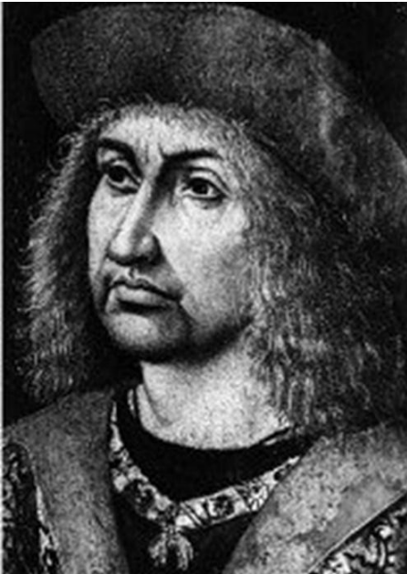
Albrecht van Saksen (de Kloekmoedige) Potestaat van Friesland (1443-1500)