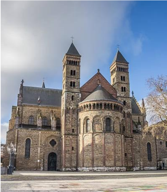
Misschien leek het Odulfusklooster wel op de hierboven afgebeelde Sint Servaasbasiliek in Maastricht (van oorsprong uit de 6 e eeuw)