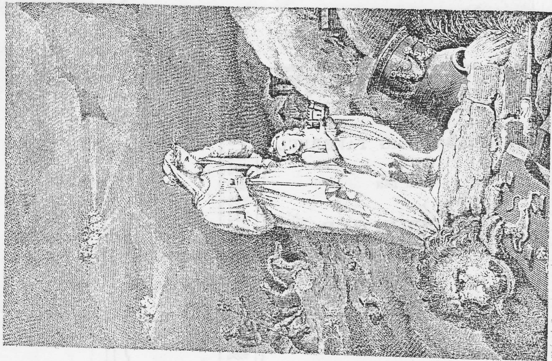
By van der Vliet, voor de Maat 1835.

't Welddagig Nederland zal ook uw tranen droogen.